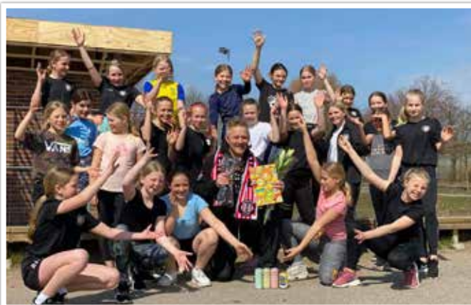
Höllviken BK:s F09 fick komma på träning med fokus på attityd, laganda och samarbete i maj.