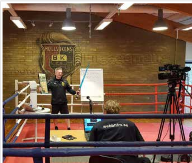
I februari blev det filminspelning i samband med Kens examination som Idrottsmentor med rubrik "Från slugger till eldsjäl".