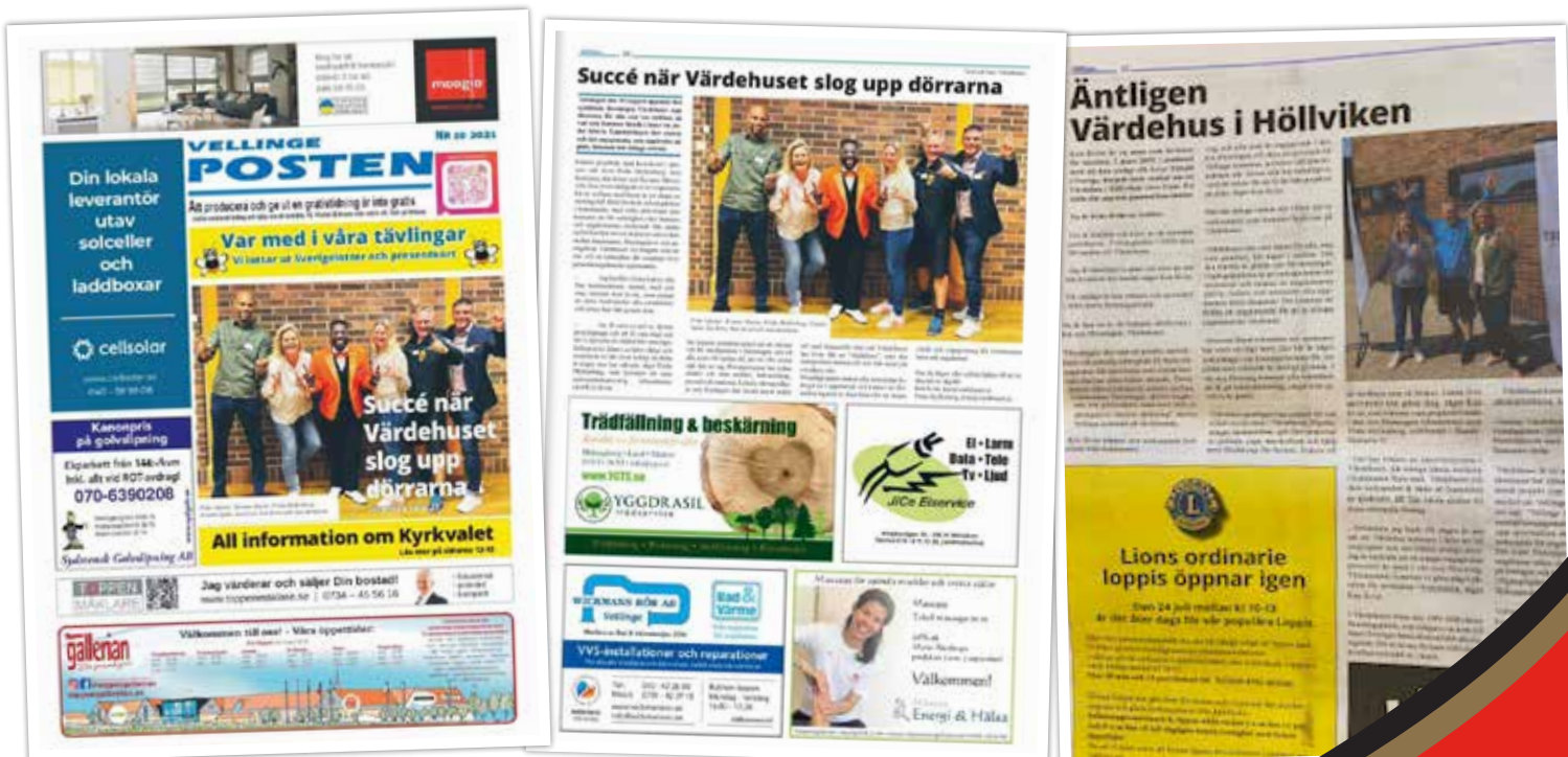
Flera medier skrev om öppningen av Värdehuset i augusti.