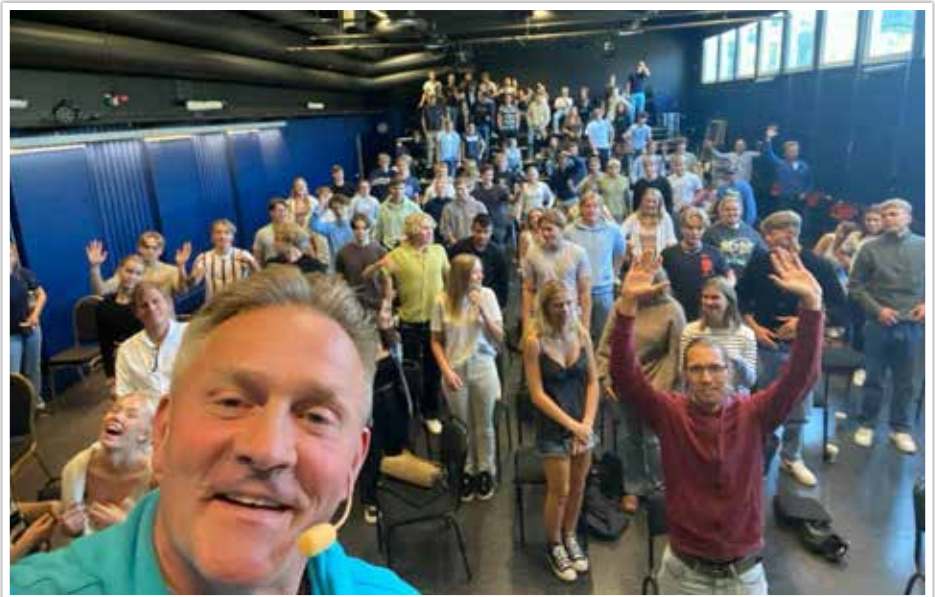
Föreläsning för UF-elever på Sundsgymnasiet i augusti på temat inspiration och målsättningar inför framtiden.

Klubbens kunskaper och erfarenheter fortsätter att vara attraktiva och det kommer regelbundet in förfrågningar om att föreläsa från olika aktörer.