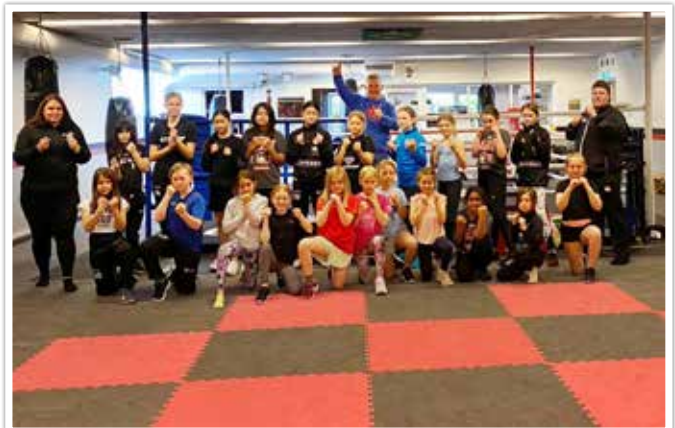
Malmö Redhawks tjejer hade teambuilding på klubben i maj.