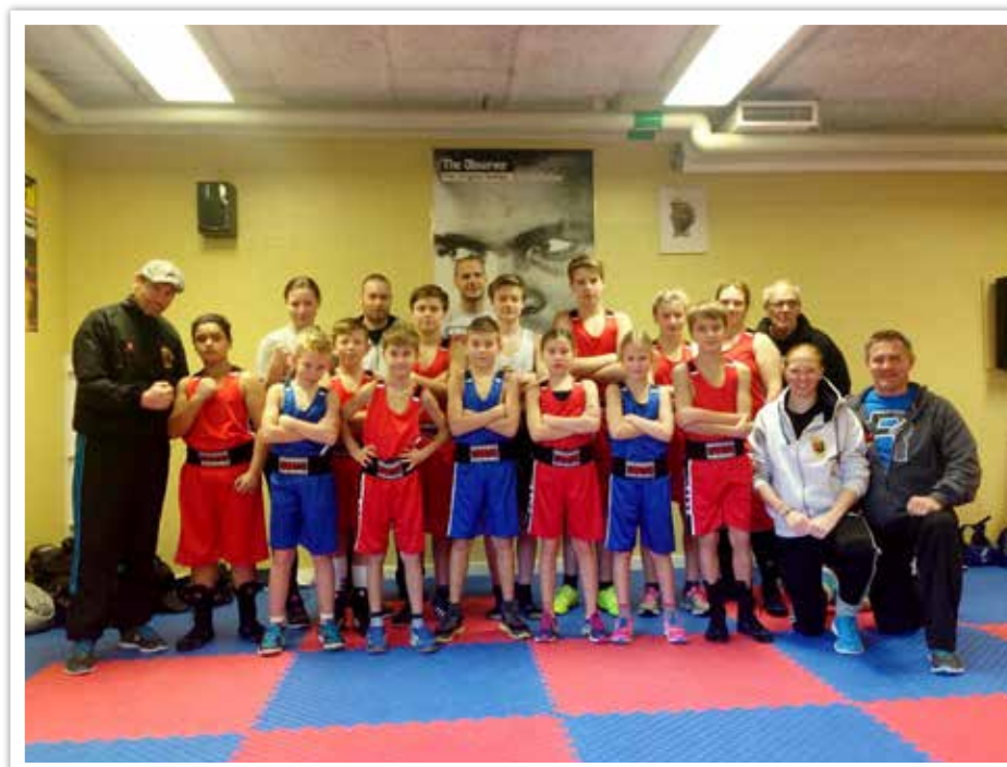
Diplomgänget som höll igång 2015.

22-24 maj Future Fighting Boxing Camp VI/Höllviken