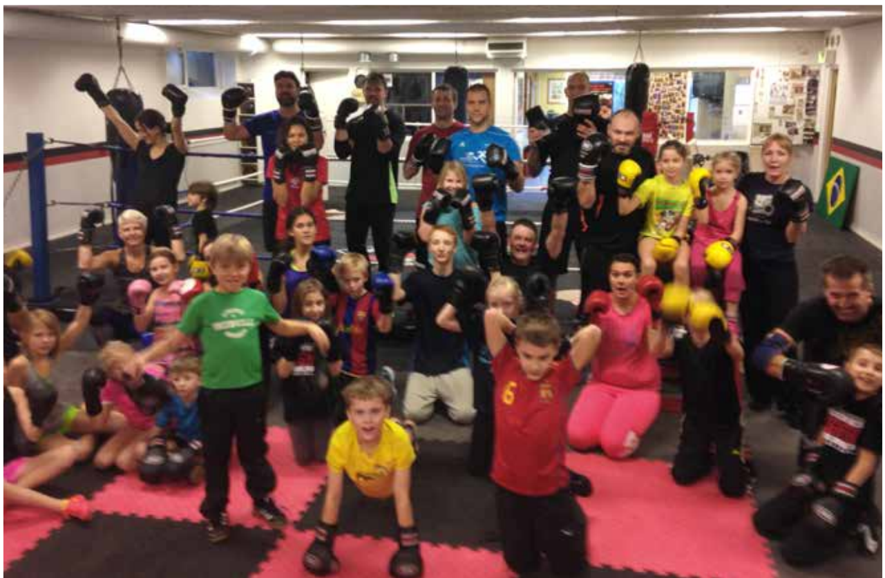
En vanlig lördag förmiddag på klubben: 34 barn och föräldrar tränar tillsammans.

Passen hålls varje lördag förmiddag mellan kl 10 och kl 11.30 av en till två tränare. Träningen är uppbyggd med en delvis lek-och-lär idé från oss tränare. Idén är att uppmuntra till lärande genom att blanda träning med lekfulla övningar. Barnen ska få chansen att lära sig boxningens grunder under lekfulla former samtidigt som föräldrarna får möjlighet att under ett antal tillfällen under passet träna riktigt hårt. På så sätt har hela familjen dragit nytta av denna typ av träningspass. En bra start på en helg helt enkelt!”