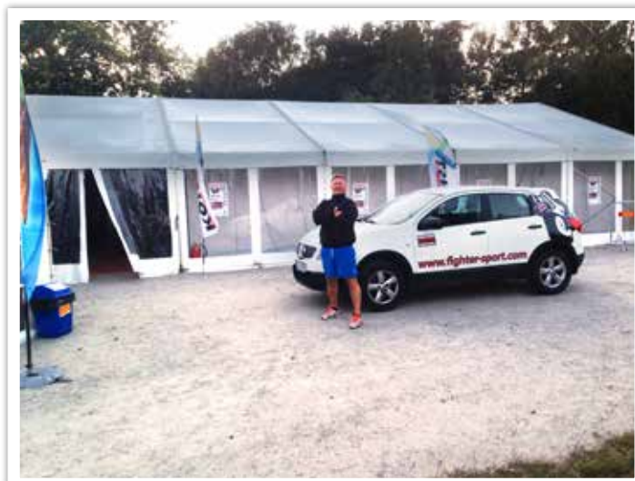
I drygt 14 dagar under sommaren vaktade boxningsklubben konstföreningens dyrbara alster – ytterligare ett sätt att få in pengar till klubbkassan.