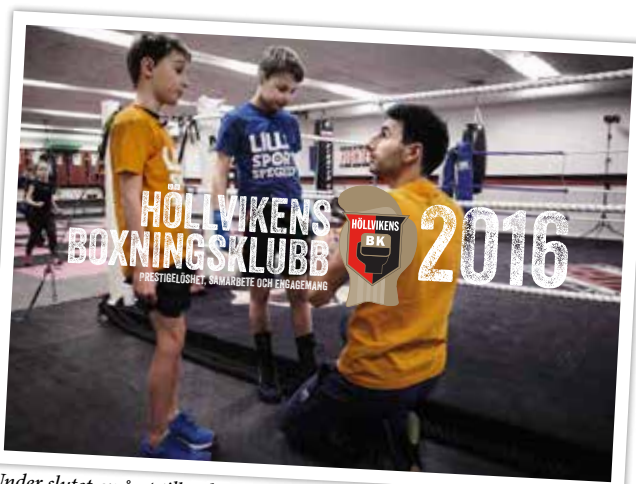
Under slutet av året tillverkade klubben en kalender med bilder från alla delar av vår verksamhet som delades ut till hushållen i kommunen.