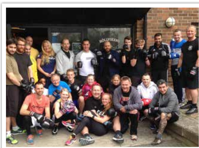
Klubben arrangerade steg 1-tränarutbildning i Svenska Boxningsförbundets regi.