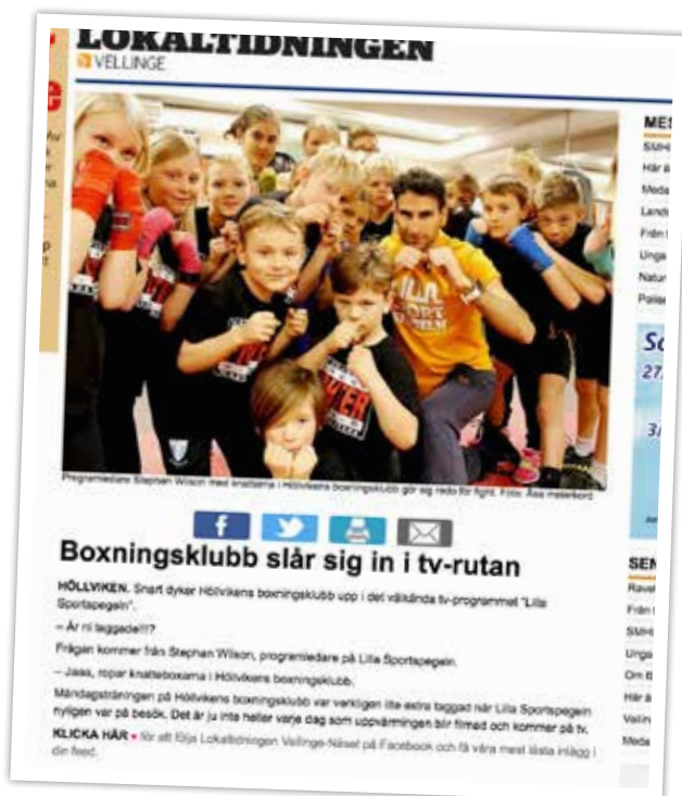
SVT:s Lilla sportspegeln kom och hälsade på och gjorde reportage om klubbens ungdomsverksamhet – vilket även uppmärksammades av Lokaltidningen.