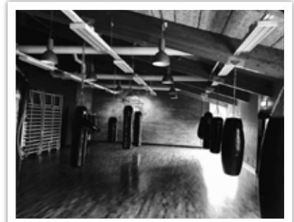
Ovanvåningen färdigställdes och används flitigt.