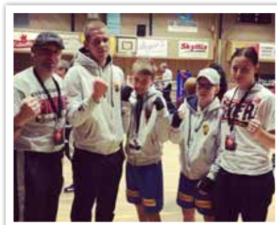
Ett glatt gäng åkte till Angered och ACBC.