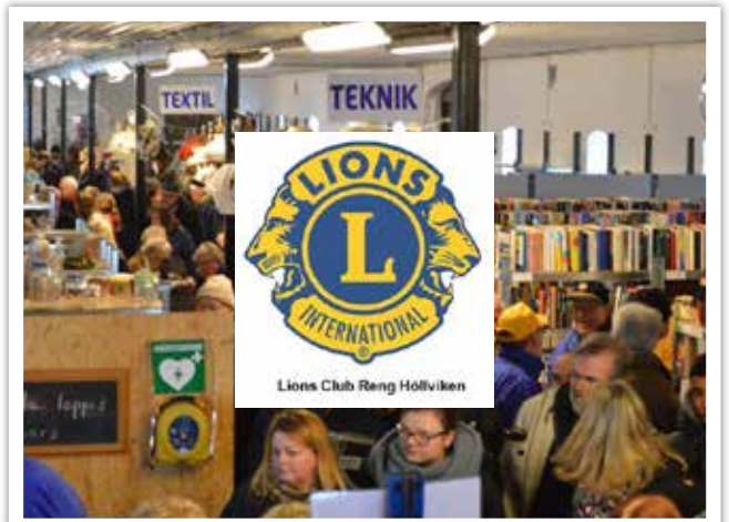
Lions i Reng gav klubben ett stöd på 15 000 kronor som ska gå till ungdomsverksamheten.