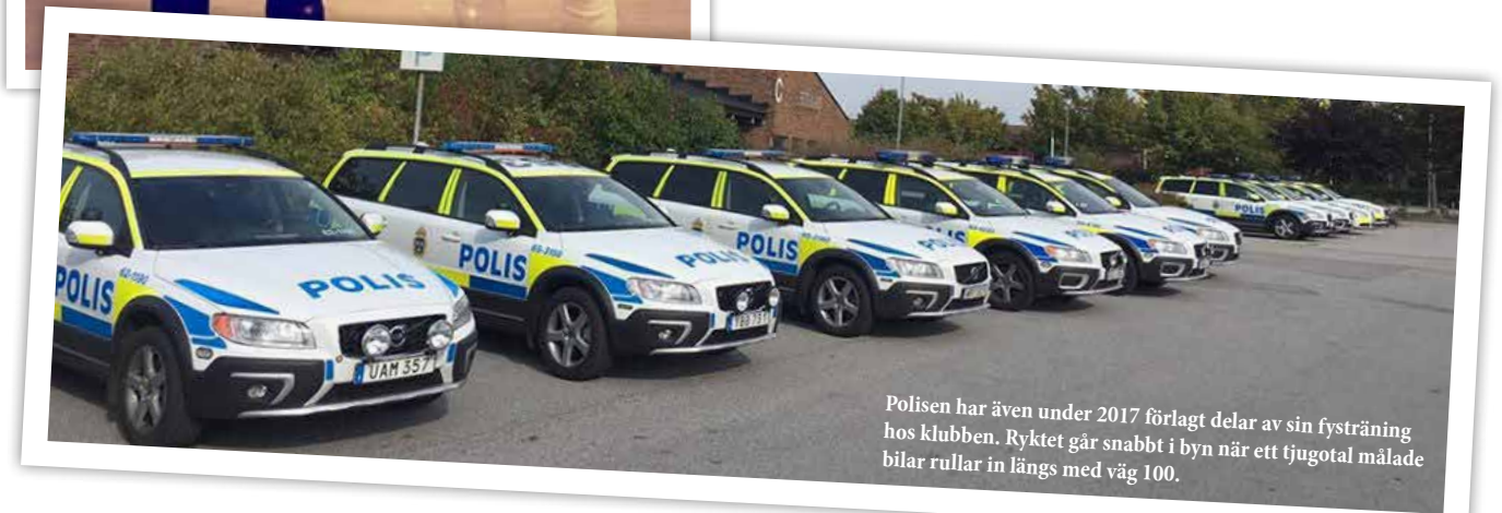
Polisen har även under 2017 förlagt delar av sin fysträning hos klubben. Ryktet går snabbt i byn när ett tjugotal målade bilar rullar in längs med väg 100.