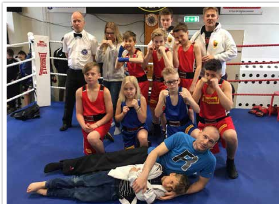
Ett framgångsrikt diplomgång.