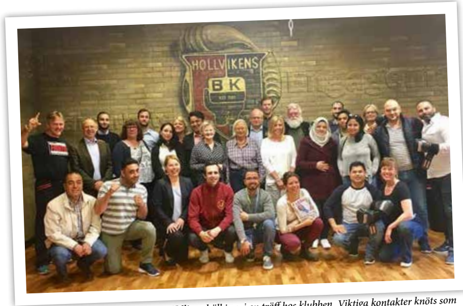
Näringslivsupproret för integration i Vellinge höll i maj en träff hos klubben. Viktiga kontakter knöts som skapat både praktikplatser och arbetstillfällen.