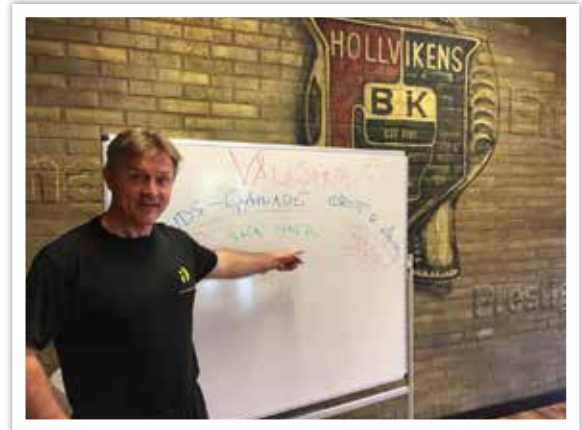
Samarbetet med kommunens skolor fortsatte. Sundsgymnasiet, Ängdalaskolan, Skanör Falsterbo Montessoriskola och Granviks förskola var hos oss och lärde sig mer både om boxning, men också om värdegrunder med fokus på respekt och disciplin.