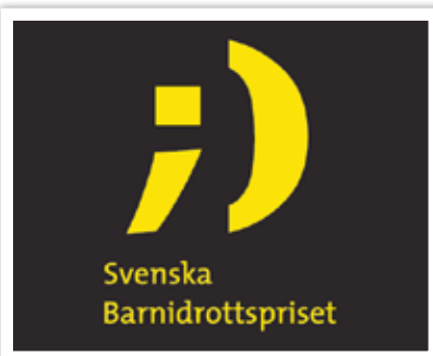
Klubben nominerades till Svenska Barnidrottspriset för sin omfattande verksamhet med barn och ungdomar i alla åldrar och samhällsklasser.