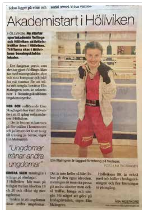
Klubben deltog i projektet Sportakademin, men projektet lades ner på grund av bristande intresse från allmänheten.