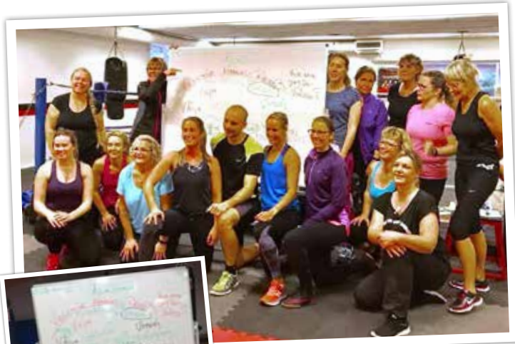
Vellinge Kommuns sjukgymnaster/fysioterapeuter besökte klubben vid ett flertal tillfällen under 2017 för träningar och föreläsningar.